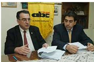
Ing. José Villarejo (izq.)

La elaboración de un catastro digital de todo el territorio nacional puede tener un costo cercano a los 300 millones de dólares, según el director del Servicio Nacional de Catastro, José Villarejo. El funcionario informó que, gracias a una gestión realizada ante la Embajada brasileña, la administración podrá contar con imágenes de un satélite del vecino país.