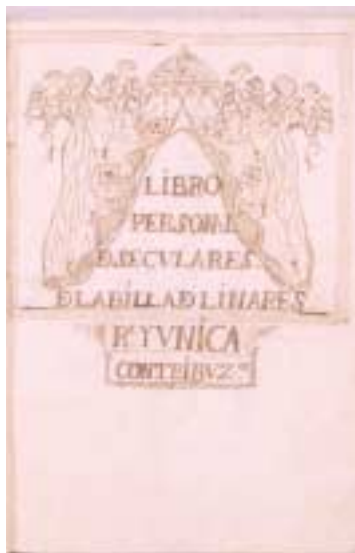
Portada del libro personal de seglares ( libro de los cabezas de casa ) de la villa de Linares. (AHPJ).

[9] Este año, debido a trabajos muy concretos, las consultas de los Libros de Sentencias (133) y Sumarios (121) de la Audiencia Provincial y las del Catastro de Rústica y Urbana (112) superaron al Catastro de Ensenada (104).