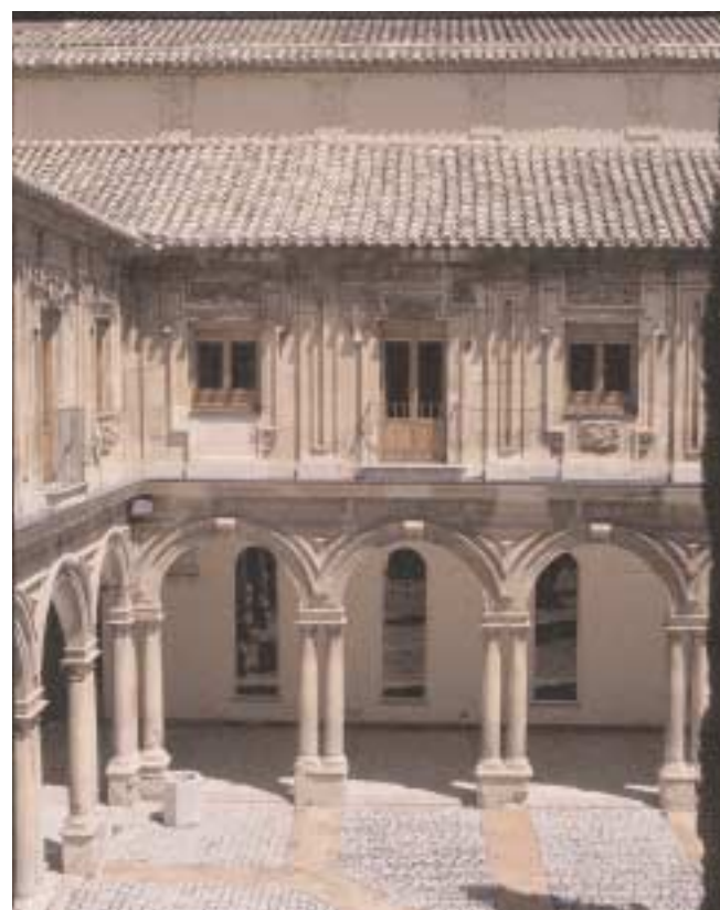
Portada del libro que contiene las respuestas generales de Cazorla, claustro del convento de Santa Catalina Mártir, donde hoy se encuentra situado el Archivo Histórico Provincial. Abajo, páginas de las respuestas generales de Santisteban del Puerto y de Andújar. (AHPJ).