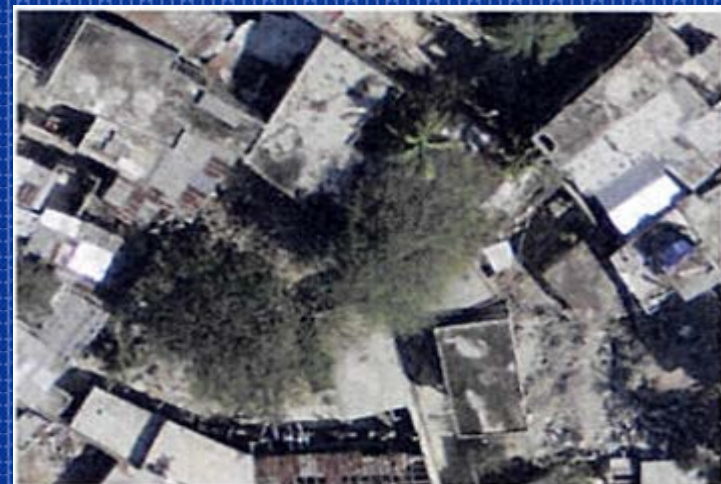
Vegetación oscureciendo la trama

Algunos límites de la tierra no se materializan, y no se pueden levantar que con la información proporcionada por una persona que tiene conocimientos de la parcela (propietario, ocupante, inquilino, vecino ).