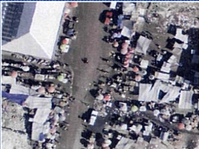
Mercado a la baja poco

Restitución fotogramétrica no se puede ver todo.