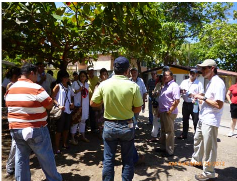
Figura N° 3 Explicación técnica de la delimitación de la ZMT.

Elaborado por: Ing. Guillermo Rodríguez R